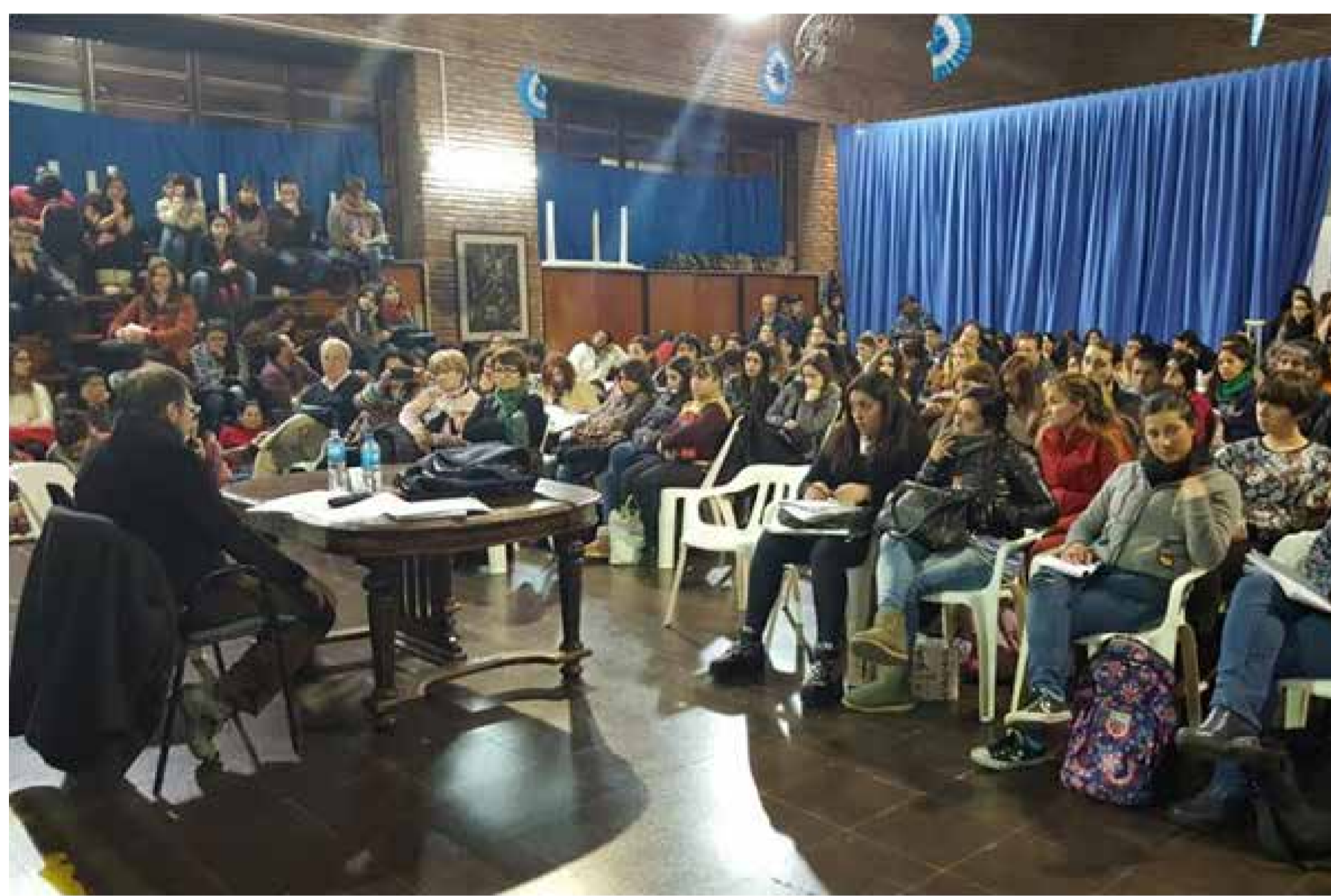
"La reflexión sobre el lenguaje en Segundo Ciclo de la EP"